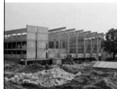
Vue du chantier du Complexe Nelson Paillou.

Le complexe des sports collectifs de petits terrains (Nelson Paillou) est construit.