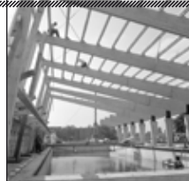
Vue du chantier du Centre nautique Émile Schœbel.