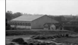
Le Hall Bois de l'INS et les bâtiments du Laboratoire central des Sols Sportifs en 1949.

Le CNMA est transféré sur Paris à la Redoute de la Faisanderie, pour les hommes et à Chatenay-Malabry, pour les filles.