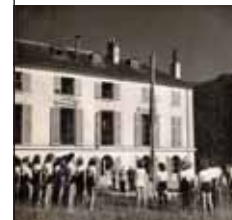
Visite du commissaire général aux sports, Joseph Pascot au Collège National de Moniteurs et d'Athlètes filles.