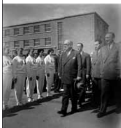
Vincent Auriol, Président de la République lors de l'inauguration de l'INS le 6 juin 1952.

L'École Normale Supérieure d'Éducation Physique (ENSEP) quitte la Redoute de Gravelle et s'installe dans les bâtiments fraîchement construits dans la partie Nord-est.