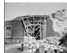
Démolition de la Redoute de la Faisanderie, berceau de l'École de Joinville, en mars 1971

La Redoute de la Faisanderie est détruite pour réaliser les travaux de l'autoroute A4; sa porte d'entrée, sauvée de la démolition, est érigée à l'INSEP près du stade d'athlétisme Gilbert Omnès.