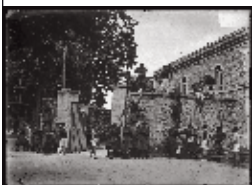
Soldats s'entraînant devant l'entrée de la Redoute de la Faisanderie.

Ouverture de L'École Normale de Gymnastique de Joinville.