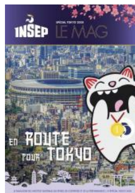
INSEP LE MAG, JEUX OLYMPIQUES ET PARALYMPIQUES INSEP LE MAG SPÉCIAL JOP TOKYO 2020